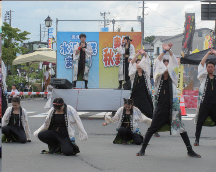
第2回奥州秋まつり

この会報は『電子版』でもご覧いただけます。(ホームページ http://www.oshucci.com/ )