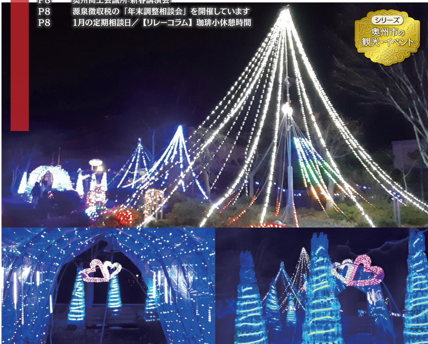
水沢南地区センター イルミネーション

この会報は『電子版』でもご覧いただけます。(ホームページ http://www.oshucci.com/ )