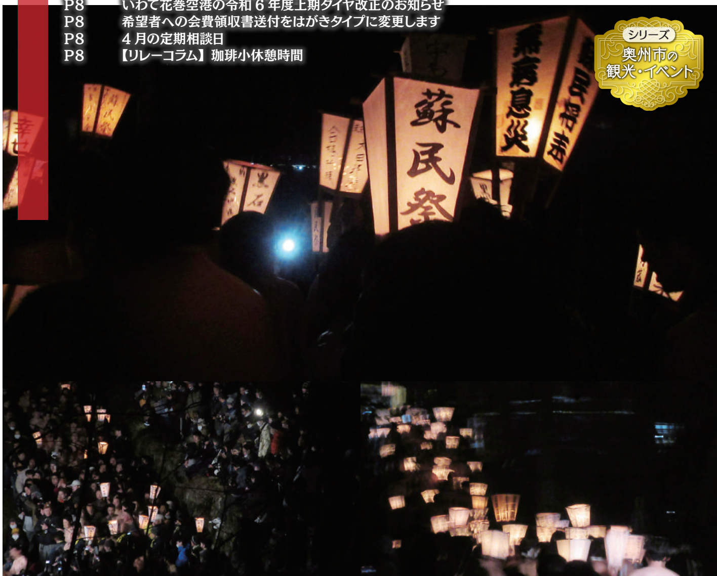
千年以上の歴史に幕 ～黒石寺蘇民祭～

この会報は『電子版』でもご覧いただけます。(ホームページ http://www.oshucci.com/ )