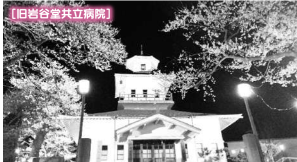
【旧岩谷堂共立病院】