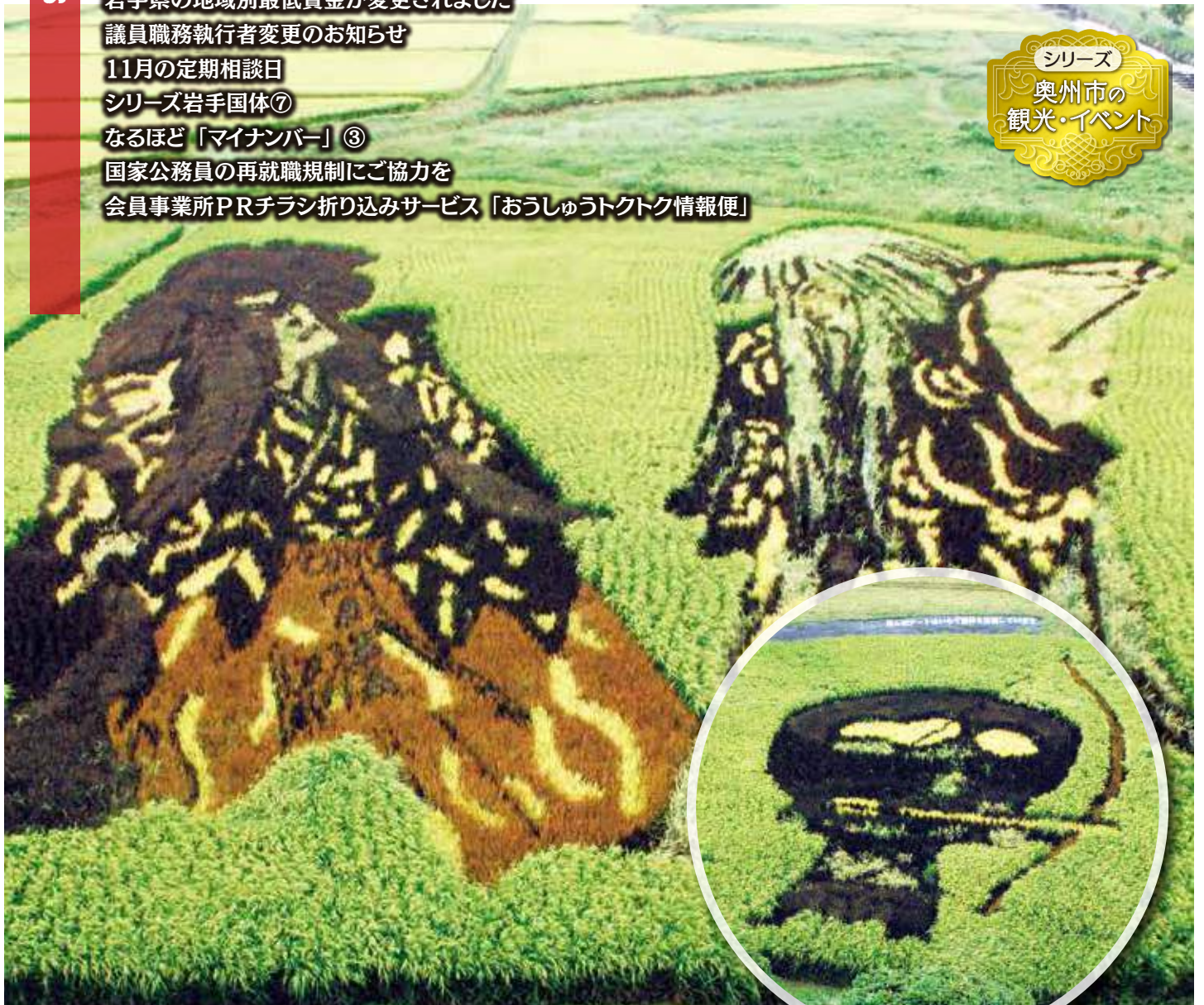
田んぼアート / 毎年恒例の、色の違う稲を植え分けて模様を描く「田んぼアート」が、奥州市水沢区内「巢伏の檜」から見られました。今年の題材は、歌舞伎舞踊「連獅子」と岩手国体マスコットキャラクター・わんこきょうだいの「おもっち」の弓道バージョンでした。