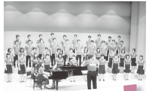
岩手大学合唱団ミニライブ