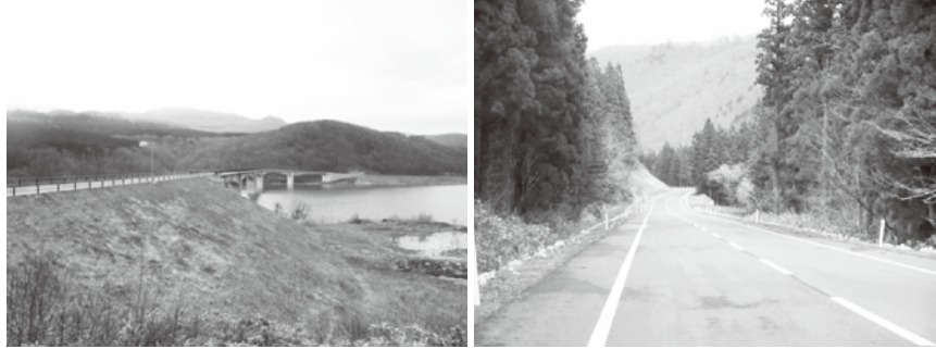
栗駒焼石ホットライン

栗駒焼石ホットラインは、総延長約16キロに及び、胆沢ダムや奥州湖、焼石連峰や栗駒山などを結んでおりますので、たくさんの絶景を望むことができます。胆沢ダム、奥州湖の雄大な景色、そして今の季節は新緑まぶしい焼石連峰の景観が広がっております。ドライブに栗駒焼石ホットラインの大自然を満喫しにぜひ楽しみにいらしてください。