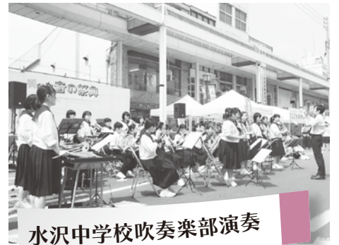
水沢中学校吹奏楽部演奏