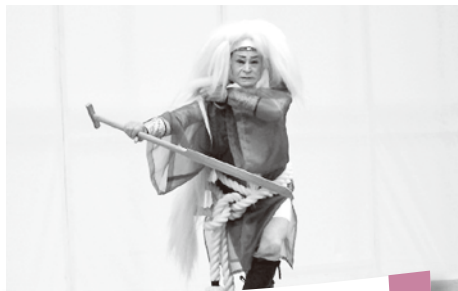
美よし舞踊ショー