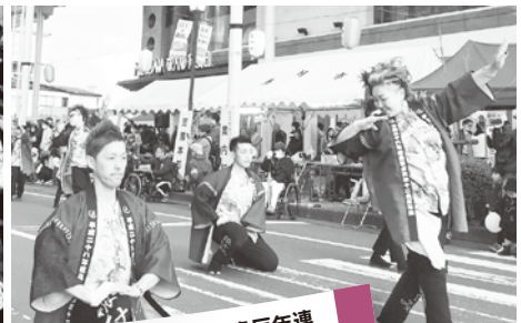
平成28年度奥州水沢42歳厄年連