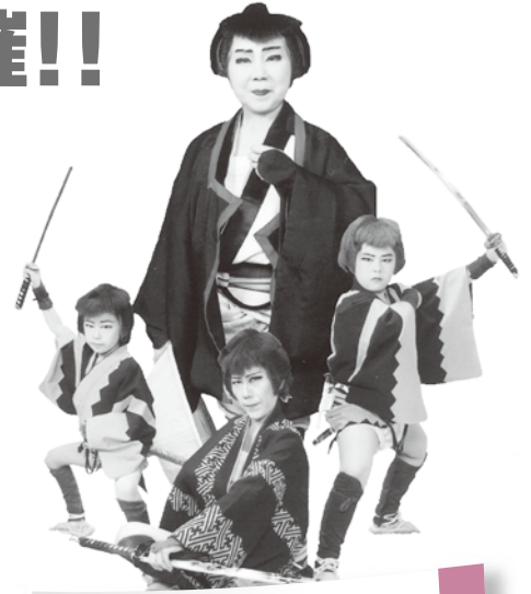
美千代舞踊団舞踊ショー