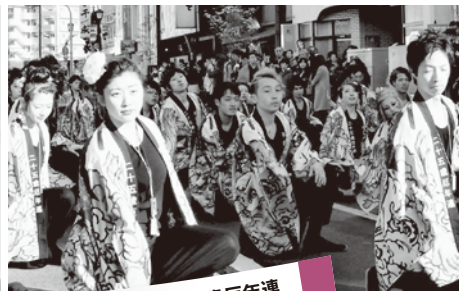
平成28年度奥州水沢25歳厄年連