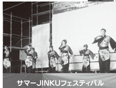
サマーJINKUフェスティバル