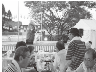
供養塚「屋台村」昨年の様子→