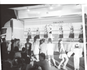
昨年の「小山じゃごたるナイトふえすていばる」