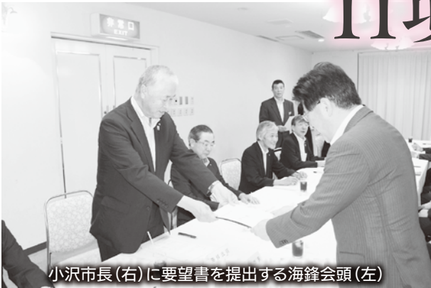
小沢市長(右)に要望書を提出する海鋒会頭(左)

奥州商工会議所は7月10日(月)奥州市と意見交換会を開催し「平成29年度地域振興及び産業振興に関する要望書」を11項目にまとめ、奥州市に提出しました。