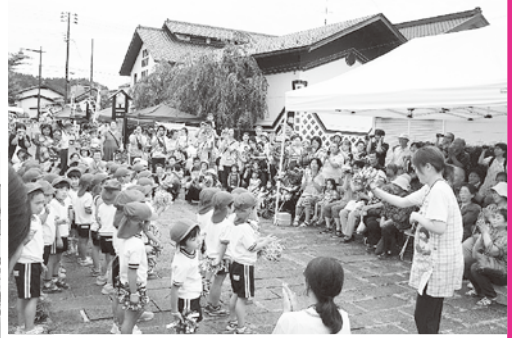
▲八日市幼稚園の園児による 歌と踊りの披露(昨年の様子)