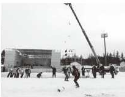
◀写真は昨年の様子