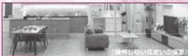
「想像しない住まいの提案」