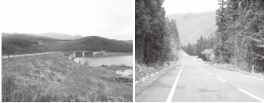
栗駒焼石ホットライン

「栗駒焼石ホットライン」は約15キロに及び、胆沢ダムや奥州湖、焼石連峰や栗駒山などを結んでおり、数々の絶景を望むことができます。胆沢ダム、奥州湖の雄大な景色、そしてこの時期は新緑まぶしい焼石連峰の景観が広がっております。ドライブや観光にぜひご活用ください。