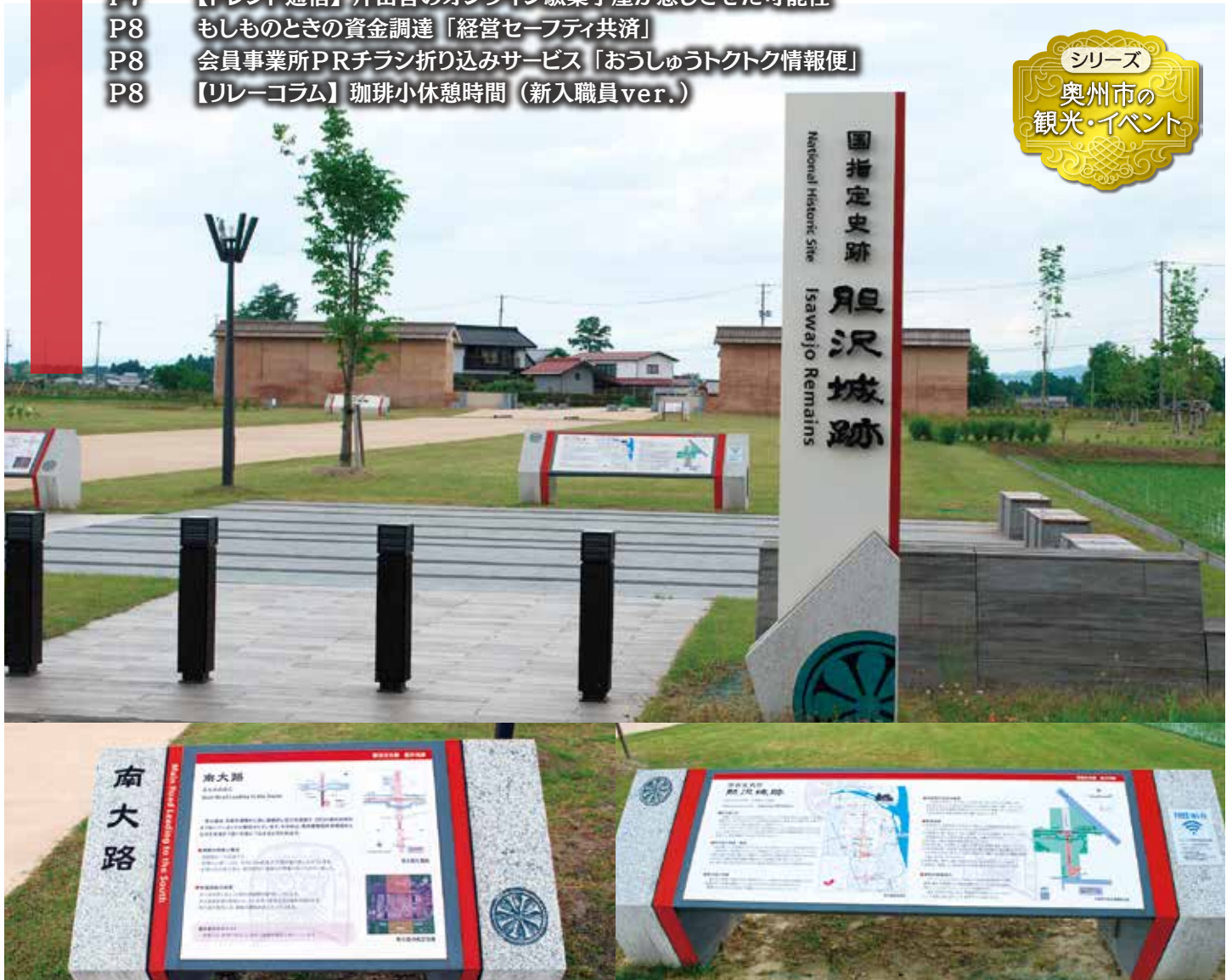
胆沢城跡歴史公園 / 胆沢城は、延暦21(802)年に坂上田村麻呂が造営した平安時代の城柵(国が地方に造った政治と軍事の拠点となる役所)跡です。奥州市埋蔵文化財調査センターでは、歴史公園で使用できるタブレットを貸し出しているほか、センター内貸出用の専用ゴーグルで「VR胆沢城」を体感することもできます。

この会報は「電子版」でもご覧いただけます。(ホームページhttp://www.oshucci.com/)