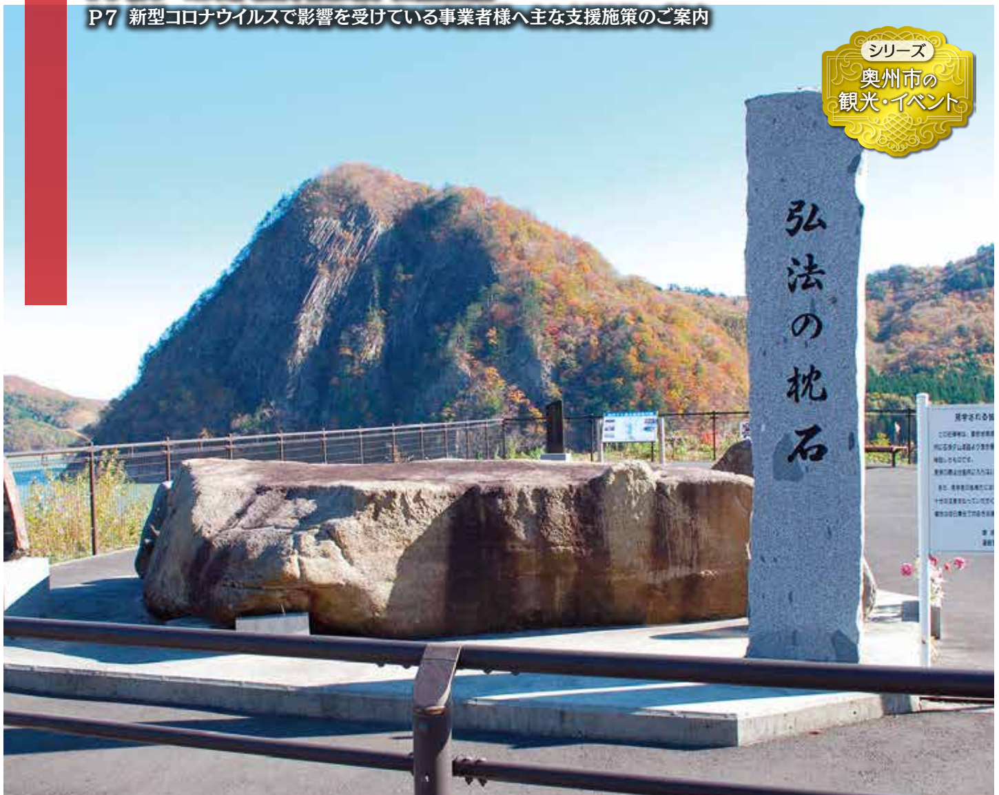
弘法の枕石(おろせ広場) / 国道397号線の胆沢ダムの近くに、巨石が置かれています。弘法の枕石と呼ばれ、その昔弘法大師が一夜を伏したという伝説のある巨石。駐車場があり、下嵐江おろせ広場として整備されています。重さ15トンもあり、湖底から苦勞して曳き上げたとのこと。(撮影: 2019年11月)

この会報は『電子版』でもご覧いただけます。(ホームページ http://www.oshucci.com/ )