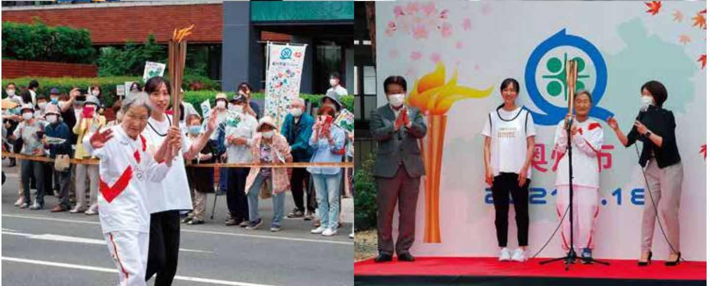
東京2020オリンピック聖火リレー

この会報は「電子版」でもご覧いただけます。(ホームページ)http://www.oshucchi.com/