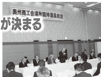
前回（令和元年11月1日）の臨時議員総会

令和4年度は、3年に一度の商工会議所役員・議員の改選期です。10月末日で役員・議員任期が満了となり、改選を行うことになっています。当所において、この議員改選にかかる日程が決まりました。