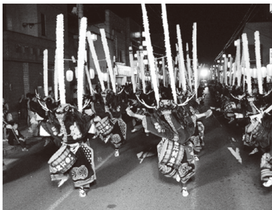
江刺鹿踊「百鹿大群舞」

みちのく盂蘭盆まつり 8.15 月 ～8.16 火 16:45～21:00 岩谷堂商店街