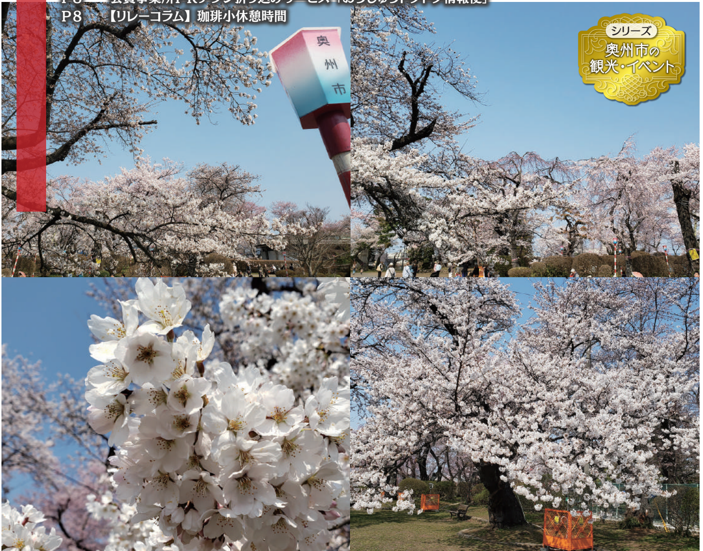
水沢公園の桜 (撮影: 2023年4月)

この会報は『電子版』でもご覧いただけます。(ホームページ http://www.oshucci.com/ )