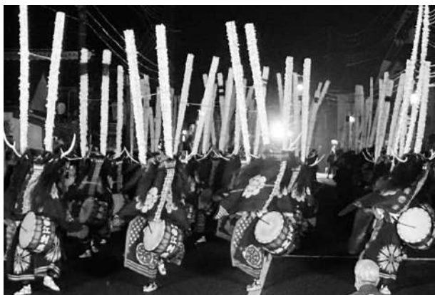
えさししおどり ひやくしかだいぐんぶ 江刺鹿踊「百鹿大群舞」