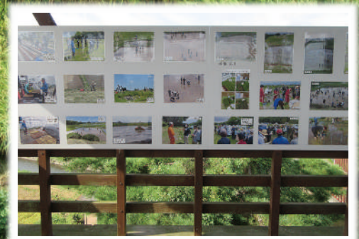
2023 アテルイの里「跡呂井田んぼアート」(水沢)

この会報は『電子版』でもご覧いただけます。(ホームページ http://www.oshucci.com/ )