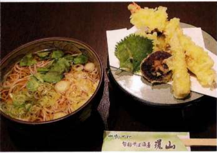
天ぶらそば 982円(税込1,080円)