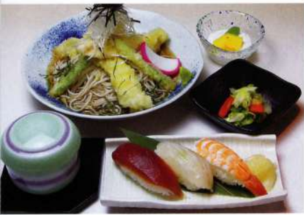
とり天そば・にぎり寿司 1,437円(税込1,580円)