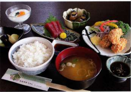
カキフライ御膳 1,264円(税込1,390円)