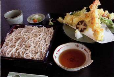
天せいろそば 1,346円(税込1,480円)