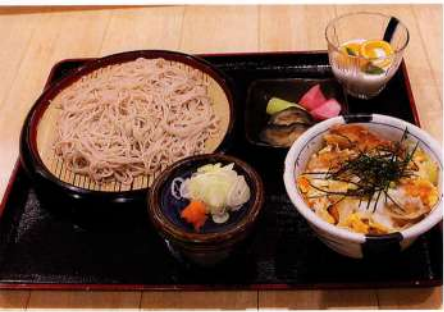
ミニかつ丼セット 891円(税込980円)