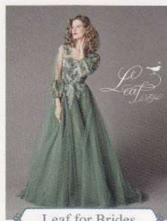
Leaf for Brides