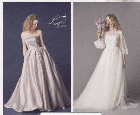
Leaf for Brides

思いがけないほどに精巧なビジュの装飾や、 デコルテを彩る様々なテクニックが、 モダンな感性を強みに、現代の女性の心を掴む。