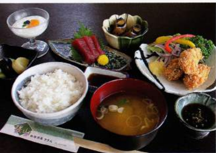
カキフライ御膳 1,250円(税込1,350円)