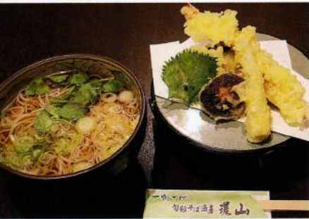
天ぷらそば 1,000円(税込1,080円)