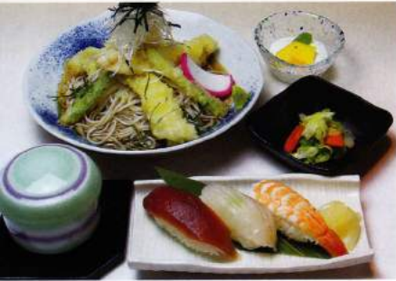
とり天そば・にぎり寿司 1,463円(税込1,580円)