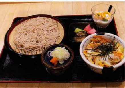
ミニかつ丼セット 908円(税込980円)