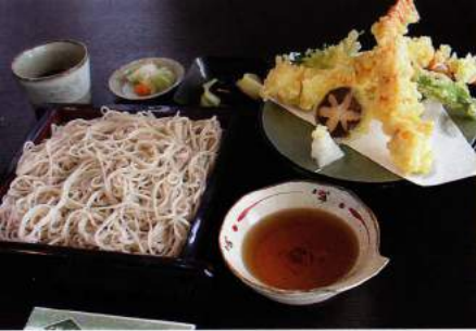
天せいろそば 1,371円(税込1,480円)

環山のそばは、すべて十割そば。つなぎを使わず、そば粉のみで仕上げています。そば本来の深い風味と食感、抜群ののどごしを、ご堪能ください。