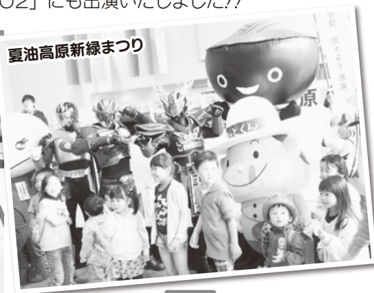
夏油高原新緑まつり