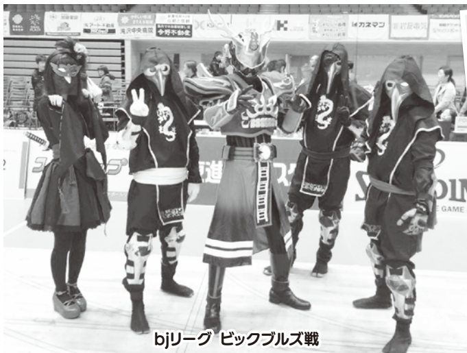
bjリーグ ビックブルズ戦

平成27年1月に誕生した「郷炎神ハクシカイザー」。昨年は江刺区内をはじめ、市内外のイベントでも大活躍。「ビックブルズ戦」や「鉄人ガンライザーNEO2」にも出演いたしました!!