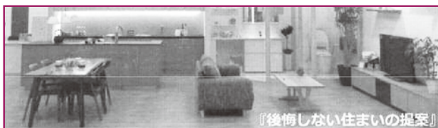
『後悔しない住まいの提案』