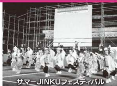
サマーJINKUフェスティバル