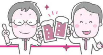
供養塚「屋台村」 昨年の様子▶