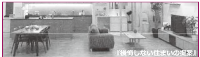
『後悔しない住まいの提案』