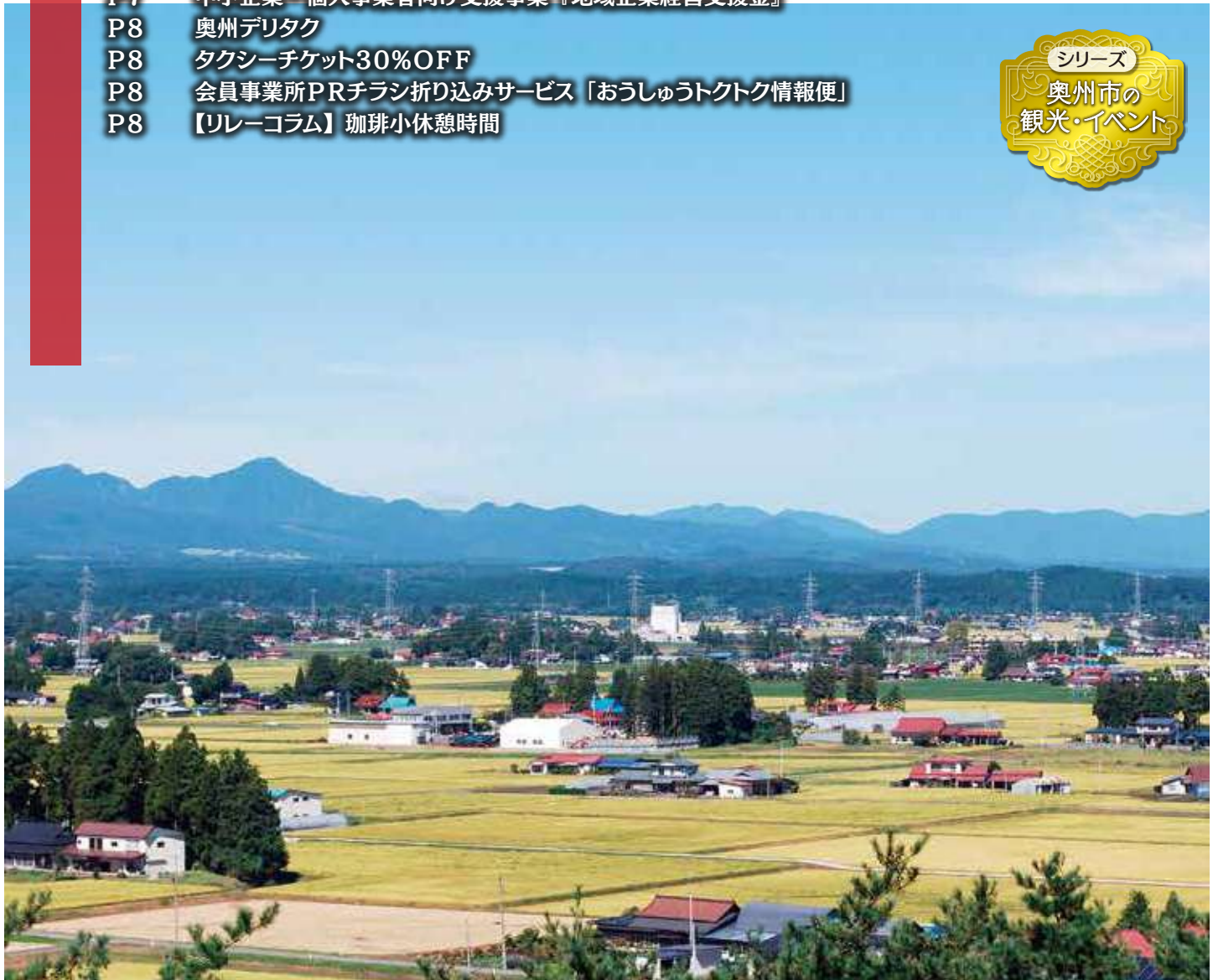
見分森公園展望台からの風景(胆沢)

この会報は『電子版』でもご覧いただけます。(ホームページhttp://www.oshucci.com/)