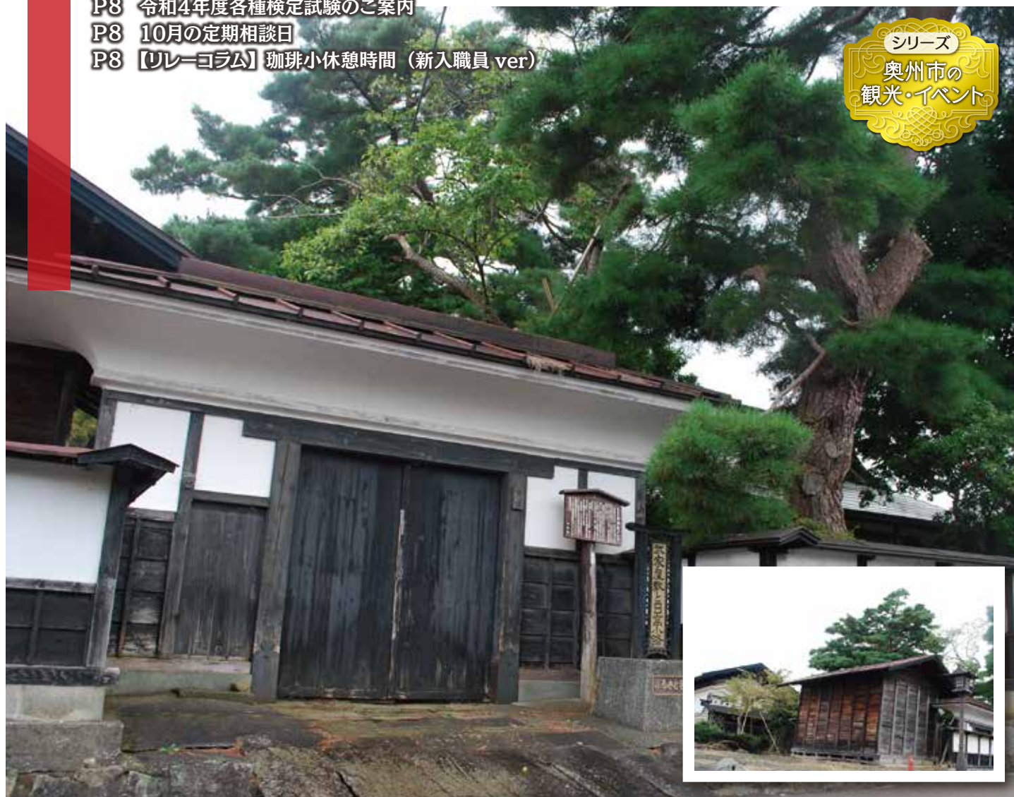
武家屋敷 安倍家(水沢) / 留守家の大番士を勤めた家臣の屋敷です。江戸時代からこの小路は「日高小路」とよばれ、武家屋敷が配置された通りです。

この会報は『電子版』でもご覧いただけます。(ホームページ http://www.oshucci.com/ )